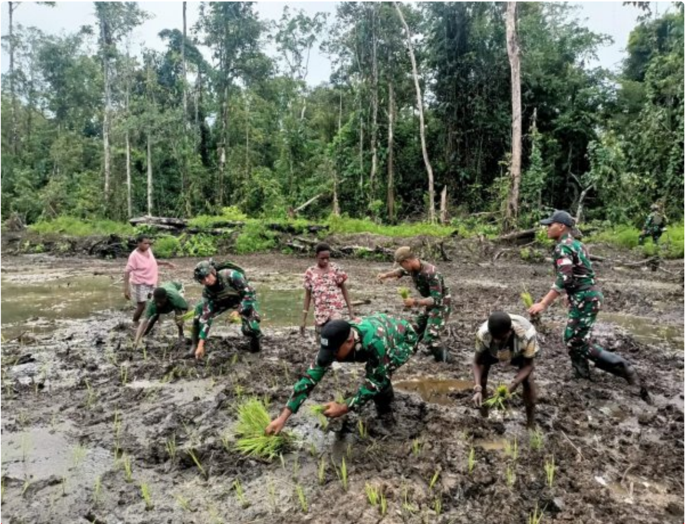
Foto: Satgas Pamtas Mobile RI-PNG Yonif 503/Mayangkara menggalas program ketahanan pangan yang melibatkan langsung warga Kampung Mumugu, Distrik Krepkuri, Kabupaten Nduga, Selasa (07/01/2025).