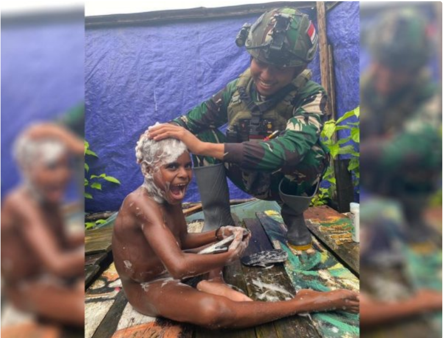
Foto: Saat Satgas Pamtas Mobile RI-PNG Yonif 503/Mayangkara Koops Habema Mengajarkan Anak-anak Menjaga Kebersihan Dengan Mandi Air Bersih di Pos Batas Batu, Kecamatan Batas Batu, Kabupaten Nduga, Papua Pegunungan, Kamis (04/07/2024).

NDUGA- Satgas Pamtas Mobile RI-PNG Yonif 503/Mayangkara Koops Habema