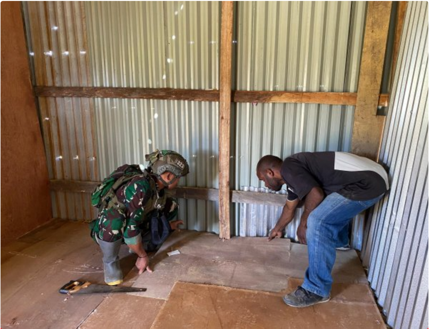
Satgas Yonif 323 Buaya Putih Titik Kuat Kodim Persiapan Membantu Masyarakat membangun Warung

Satgas Yonif 323 Buaya Putih Kostrad yang bertugas di wilayah pedalaman